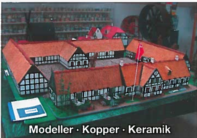
Modeller · Kopper · Keramik