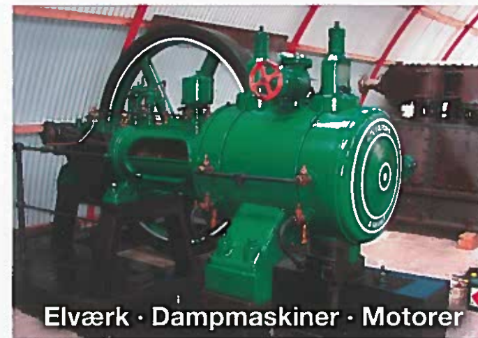
Elværk · Dampmaskiner · Motorer