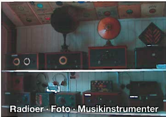
Radioer · Foto · Musikinstrumenter