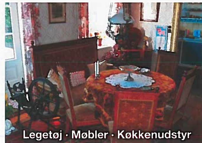
Legetøj · Møbler · Køkkenudstyr