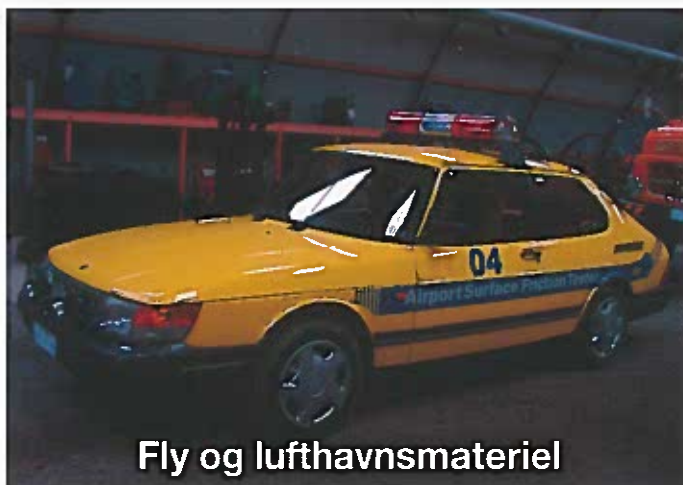
Fly og lufthavsmateriel