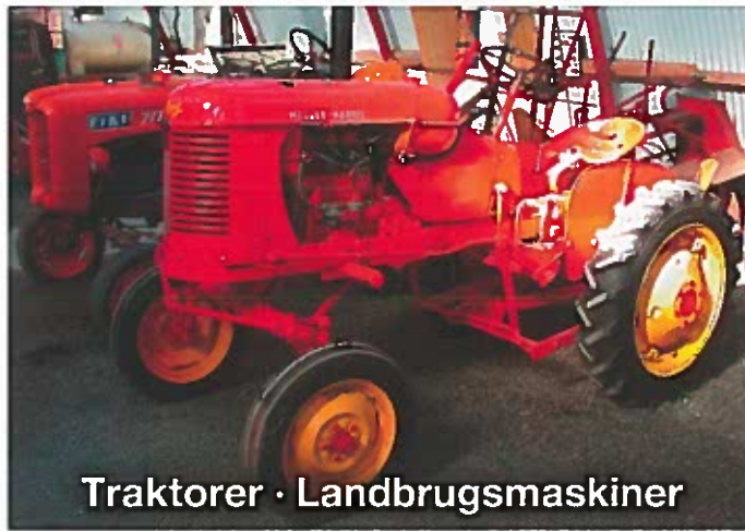
Traktorer · Landbrugsmaskiner