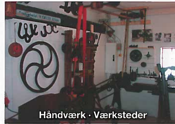
Håndværk · Værksteder