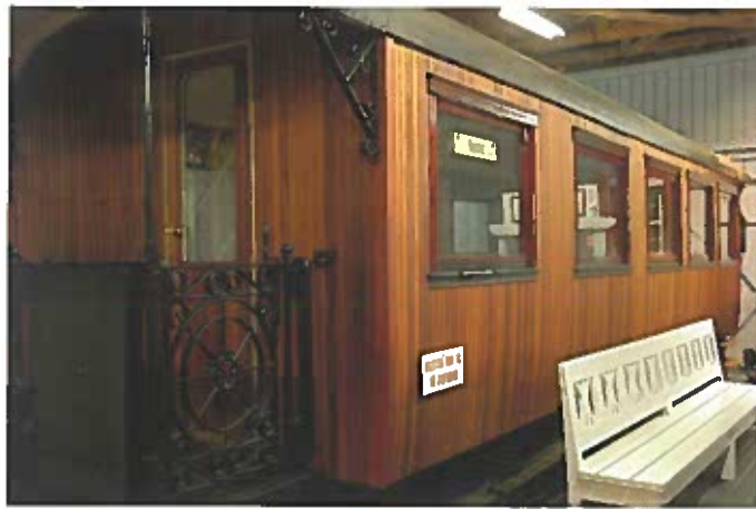
Denne store personvogn, kaldet Prins Henriks vogn, bruges ved store begivenheder, som bryllupper mv.