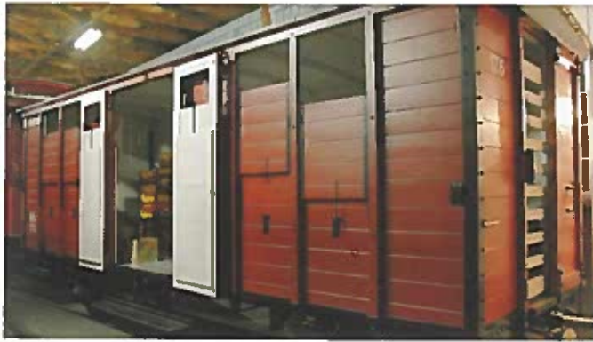
På DBJ Museum må man gå ind i alle vogne, og opleve jernbanestemningen.